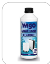
Détartrant Wigo 198700