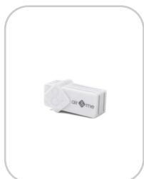
Galet Cartouche anti-germes 117213