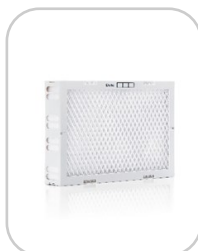
Stylies natte Filtrante 118024